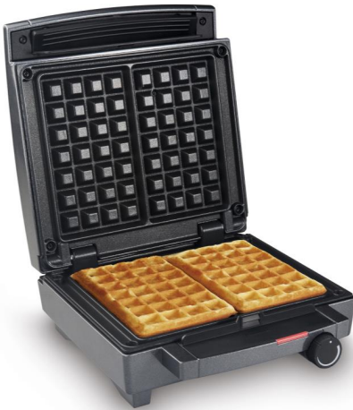
Waffle Maker WA 1451