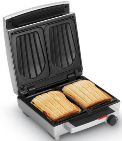
Sandwich Maker SW 1450